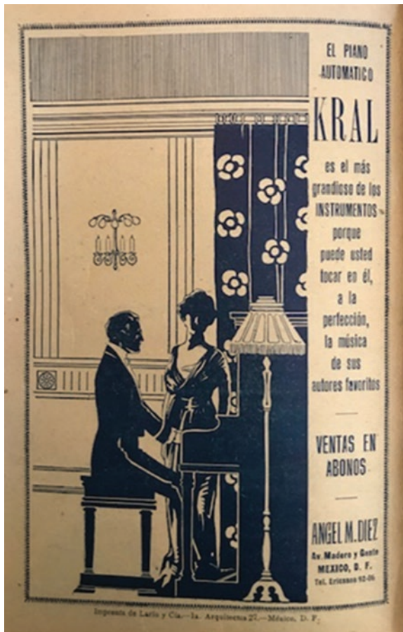
Figura 4. En 1921, Gaceta Médica de México insertó publicidad en sus páginas.

y con fundamentos basados en la experimentación propia o extraña, por lo que se requería de la lectura a través de las revistas médicas. Así, Gaceta Médica , decía Montañó, necesita ser una revista relativamente costosa tanto por su material cuanto por su presentación (Figuras 2 a 4).