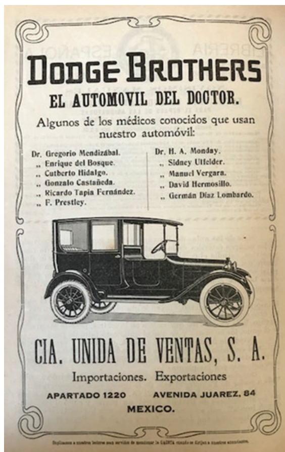
Figura 3. En 1921, Gaceta Médica de México anunció una marca de automóviles para recaudar fondos.

Retomar la impresión de Gaceta significaba regular las actividades de la Academia, hecho que fue posible gracias al apoyo que le otorgaron diversos organismos: