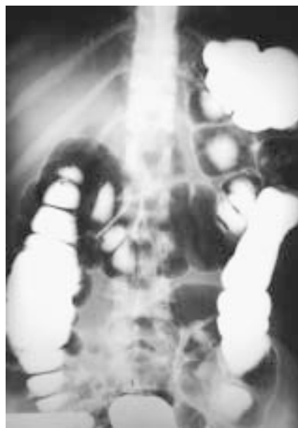
Figura 2. Colon por enema de un paciente con síndrome de intestino irritable con predominio de estreñimiento.