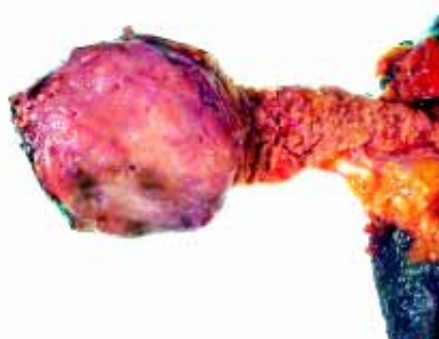
Figura 2. Producto de pancreatectomía total, en un paciente con diagnóstico de VIPoma.