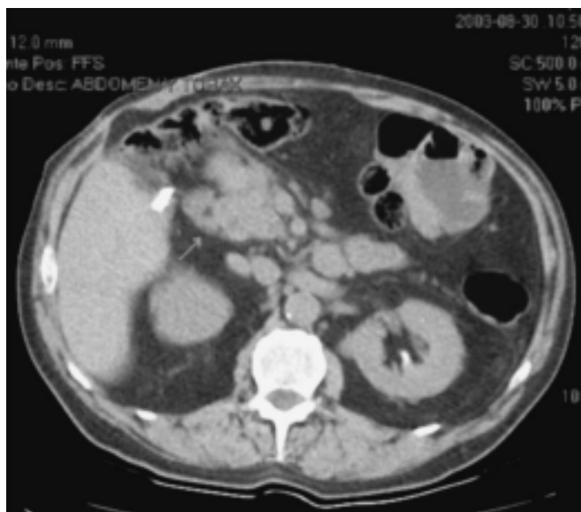
Figura 1. Tomografía axial de un paciente con diagnóstico de gastrinoma en donde se muestra tumor en la cabeza del páncreas de 6.2 x 5.3 cm.

do candidato a cirugía resectiva. Una vez establecido el diagnóstico mediante biopsia transendoscópica, se realizó embolización tanto de la tumoración pancreática como de las lesiones hepáticas, y falleció a consecuencia de insuficiencia hepática grave y coagulación intravascular diseminada.