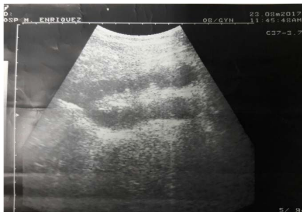
Figura 1: Se observa asas delgadas inmóviles y con edema interasas.

Ecografía abdominal (urgencia): asas intestinales no movibles, en mesogastrio, acúmulos de asas distendidas con edema y sin movimiento (figura 1).