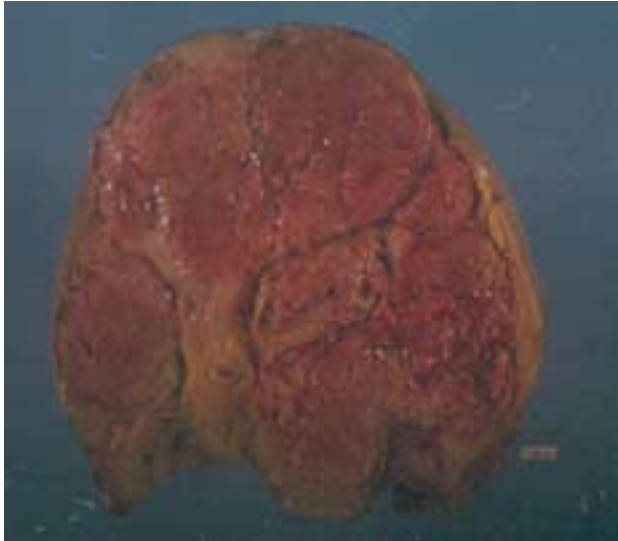
Figura 8. Imagen al corte tumor voluminoso, sólido, carnosos, multinodular, expansivo, aparentemente bien delimitado.

Se describe la baja tasa de embarazo y menor tiempo de lactancia en pacientes con tumor phyllodes, y se sugiere el ambiente hormonal como causante del tumor. 5