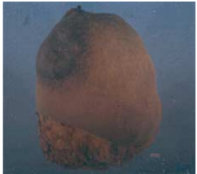
Figura 7. Pieza quirúrgica. Vista externa de la pieza con deformidad de la mama en un patrón de protrusión nodular irregular.

La OMS, en su clasificación histológica de tumores mamarios, define al tumor phyllodes como: neoplasia más o menos circunscrita, con estructura foliada, compuesta por tejido conectivo y elementos epiteliales análogos a un fibroadenoma, que se caracteriza por mayor celularidad de tejido conectivo. 4,12