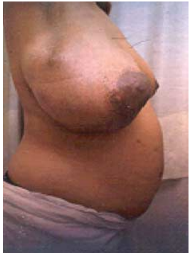
Figuras 1, 2, 3 y 4. Paciente de 32 años de edad, con embarazo de 23.4 semanas. Evolución clínica de tumor phyllodes en la mama derecha.