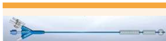
Figura 3. El catéter triple balón con los balones inflados (balón de anclaje frontal y dos balones de dilatación cervical alargados)

El inflado del balón de dilatación tarda entre 20 y 30 segundos, mientras que los balones inflados permanecen en el canal cervical durante 3 a 5 minutos. En la siguiente fase, en el canal cervical se inyecta la solución salina entre los dos balones de dilatación, a través del “canal de infusión”. Como resultado, el cuello del útero se dilata ra- dialmente, hasta conseguir el diámetro deseado. Para extraer el catéter se desinflan los balones. El diámetro final del orificio cervical interno se mide después del procedimiento de dilatación y antes del procedimiento intrauterino.