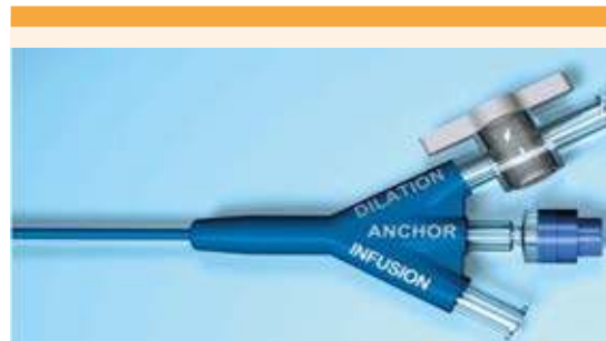
Figura 2. Mecanismo de tres canales de inyección del catéter