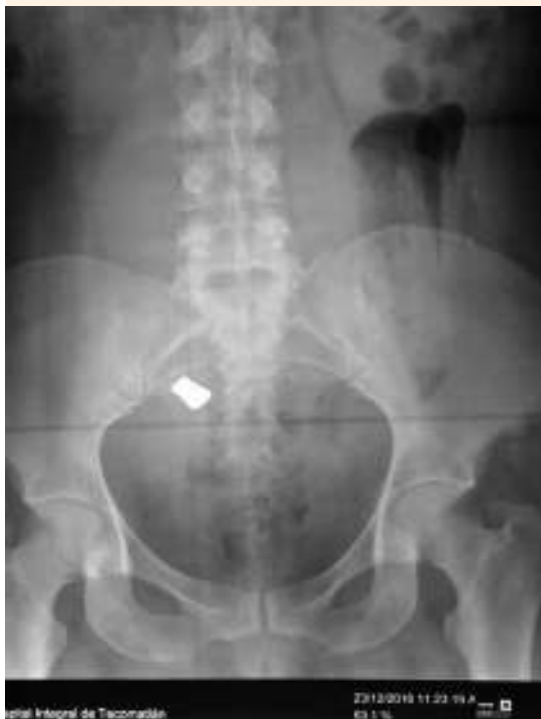
Figura 1. Radiografía que evidencia el cuerpo extraño retenido.

de gasas y compresas, percatándose de la falta del bulbo de la cánula, por lo que se procedió a su búsqueda dentro y fuera del área del campo quirúrgico. Al no obtener resultados positivos, se decidió cerrar la pared y efectuar el estudio radiológico de abdomen. La radiografía simple de abdomen evidenció una imagen radiolúcida, compatible con el oblito en la parte anterior del abdomen, por lo que se llegó a la conclusión de que el bulbo se encontraba en el útero (Figura 1). Se efectuó la reapertura de la pared abdominal y, posteriormente, la histerorrafia, donde se encontraba alojado el bulbo en la pared posterior del útero, que se extrajo de la cavidad satisfactoriamente (Figura 2), con el subsiguiente cierre de los elementos anatómicos, de acuerdo con el protocolo quirúrgico. La paciente tuvo buena evolución posoperatoria. Tanto ella como sus