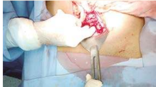
Figura 2. Reintervención quirúrgica para extraer el cuerpo extraño retenido (bulbo de cánula de Yankahuer).

familiares estuvieron informados de la complicación, a quienes se informó para la aceptación del segundo procedimiento quirúrgico.