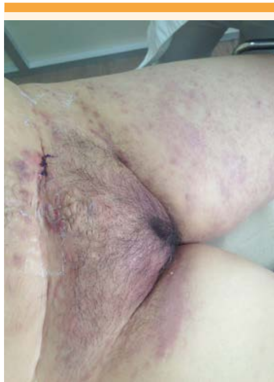
Figura 1. Combinación de máculas, nódulos y pápulas en grupos y aisladas en el abdomen, pubis y ambos miembros pélvicos, se aprecia el edema de la piel.

Al momento de aparición de la dermatosis, los principales síntomas de la paciente eran: ardor y prurito en el área de las lesiones. Recibió tratamiento dermatológico sintomático, sin éxito, en la actualidad permanece en tratamiento sistémico.