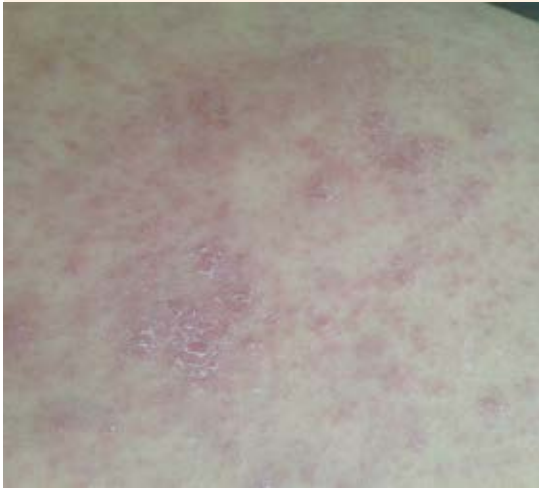
Figura 2. Nódulos y pápulas confluentes eritematosos y violáceos sobre la cara anterior de la pierna izquierda.