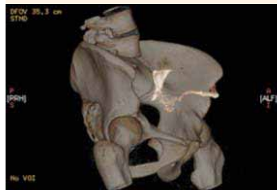
Figura 4. Tomografía 3D, corte oblicuo, con trayecto fistuloso útero-cutáneo.

de alta del hospital a las 72 horas por mejoría y la sonda vesical se retiró a los siguientes 18 días. A los 45 días del posquirúrgico acudió a valoración a la consulta externa. En la exploración física se observó un granuloma en la cúpula vaginal, que escindía. En el estudio cistoscópico la vejiga se apreció normal. El estudio histopatológico reportó: útero normal y tejido granulomatoso en el trayecto fistuloso. En la actualidad la paciente