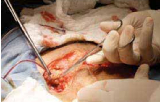
Figura 5. Incisión Pfannenstiel de piel, incluido el orificio externo de la fistula bajo guía de sonda de alimentación.