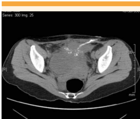
Figura 1. Tomografía, corte axial con trayecto fistuloso útero-cutáneo.