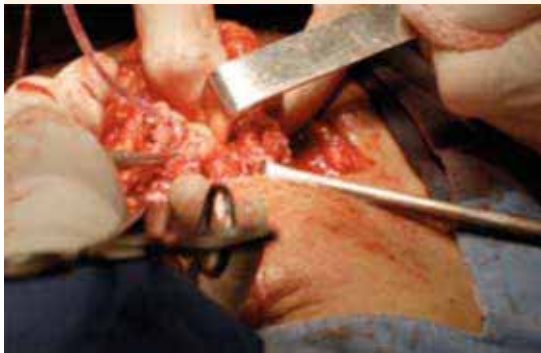
Figura 6. Disección del trayecto.

permanece asintomática, con buena evolución clínica.