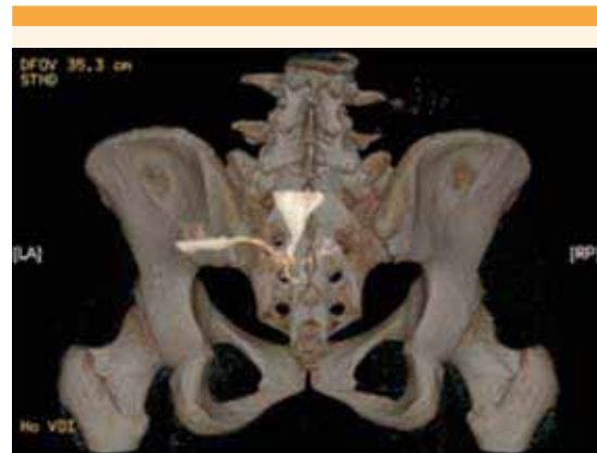
Figura 3. Tomografía 3D, corte PA, con trayecto fistuloso útero-cutáneo.

circuncidó con un corte monopolar y una tijera de metzenbaum, hasta apreciar el cuerpo uterino y cérvix firmemente adherido a la pared abdominal anterior ( Figuras 5 y 6 ). Luego, con la técnica habitual, se practicó la histerectomía abdominal ( Figura 7 ). En el transoperatorio se observó un desgarro vesical de 3 cm, que se reparó en dos planos con ácido poliglicólico 00 y se dejó una sonda Foley a permanencia. La paciente se dio