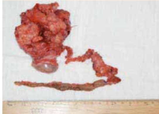
Figura 7. Pieza quirúrgica (útero y trayecto fistuloso).