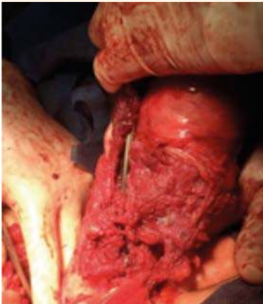
Figura 2. Área de invasión trofoblástica.

tal abdominal con conservación de los anexos ( Figura 2 ). Debido a la infiltración trofoblástica vesical, al realizar la disección vesicouterina se provocó una lesión en la vejiga, en su cara anterior, de aproximadamente 1 x 1 cm ( Figura 3 ), que fue reparada por cirugía general en dos planos, con sutura absorbible (Vycril 3-0). Se estimó una pérdida hemática de 3500 cc; durante el transoperatorio se hemotrasfundieron 6 concentrados eritrocitarios y 2 plasmas frescos congelados; se colocó un drenaje penrose por vía vaginal y se envió la pieza quirúrgica para estudio histopatológico ( Figura 4 ). La biometría hemática de control posquirúrgico reportó hemoglobina 8.7 g/dL y plaquetas 87,000. Se ingresó a la unidad de cuidados intensivos para tratamiento de choque hipovolémico, con protocolo de extubación. En total, permaneció 12 días hospitalizada (cinco días en UCI), no ameritó reintervención quirúrgica. La prueba de