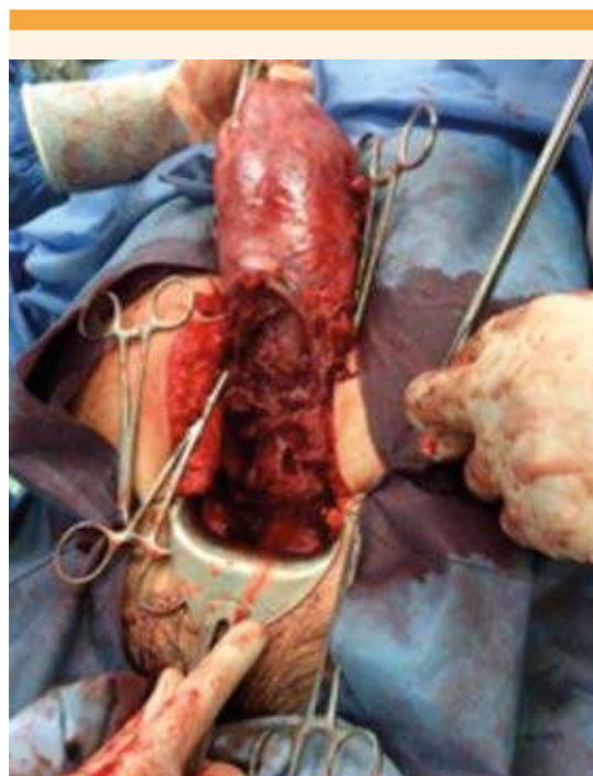
Figura 1. Placenta percreta con ruptura uterina en la cara anterior.

Se le administraron soluciones cristaloides, sin mejoría del cuadro; debido al continuo deterioro clínico y hemodinámico se decidió efectuar laparotomía exploradora, en la que se observó hemoperitoneo de 2500 cc, con ruptura uterina de aproximadamente 3 x 3 cm, localizada en la cicatriz de la histerorrafia previa, con protrusión del amnios; además, el segmento estaba muy vascularizado y con infiltración trofoblástica a la vejiga, que daba un aspecto de “medusa”. Por las características mencionadas se estableció el diagnóstico de ruptura uterina y percreetismo placentario ( Figura 1 ). Se realizó histerotomía corporal, se colocaron pinzas Foerster curvas para pinzamiento de las arterias uterinas por vía abdominal, con esto disminuyó notablemente el sangrado; posteriormente se efectuó la ligadura de las arterias hipogástricas e hysterectomía to-