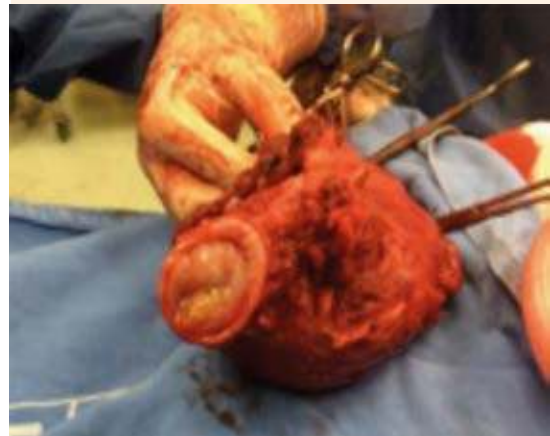
Figura 4. Pieza quirúrgica.

fenazopiridina, efectuada para verificar la salida de orina de manera involuntaria, fue positiva para probable fístula vesicovaginal. Se dio de alta de la unidad tecoquirúrgica y se envió a urología ginecológica, donde descartaron la coexistencia de una fístula vesicovaginal mediante cistoscopia. Se prescribió tratamiento con anti-muscarínicos, en dosis de 4 mg/día por vía oral y continuó con sonda Foley de silastic durante 21 días; posteriormente, tuvo evolución favorable.