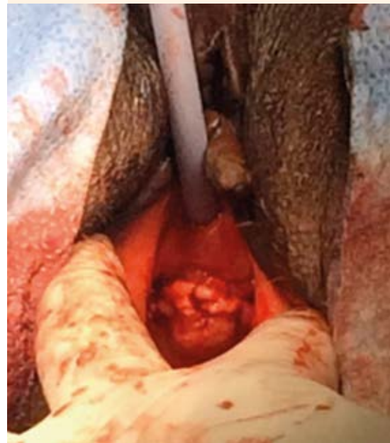
Figura 3. Apariencia posquirúrgica con incisión en U invertida.

Los síntomas urinarios son un motivo común de consulta. Para poder diagnosticar un divertículo uretral es necesario sospecharlo. La paciente del caso aquí comunicado tenía 59 años, edad superior a la del grupo con mayor incidencia que es de 30 a 50 años. 1,2,3 Los síntomas urinarios se asocian con dolor y aumento de volumen en torno de la vagina, en 50% de estas pacientes es posible que no se palpe la masa. 10,11 Entre los antecedentes relevantes estuvo la terminación de los embarazos