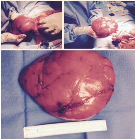
Figura 4. Tumor lobulado de aproximadamente 18 cm y 850 g.

filodes, infecciones e hipertrofia virginal. Esta última es bilateral, con dolor, calor y rubor en la tumoración. 6