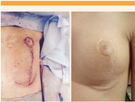
Figura 6. La imagen del lado izquierdo corresponde al estado posquirúrgico inmediato. La del lado derecho a los seis meses posteriores a la operación.

cm; 3) fibroadenoma intermedio, con diámetro de 4 a 5 cm y 4) fibroadenoma gigante, que aparece en adolescentes y mujeres en la perimenopausia. 10