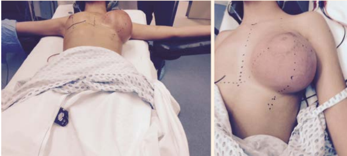
Figura 3. Preparación preoperatoria, con marcaje de la incisión para la resección y reconstrucción.