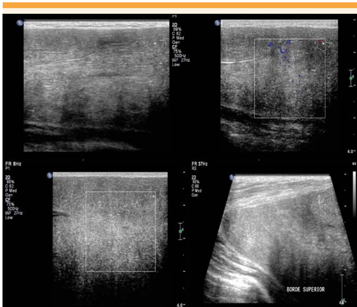
Figura 2. Ecografía mamaria. Se observa tejido homogéneo de bordes nítidos.

y epitelio sin datos de atipia. No hubo evidencia de malignidad. Figura 5