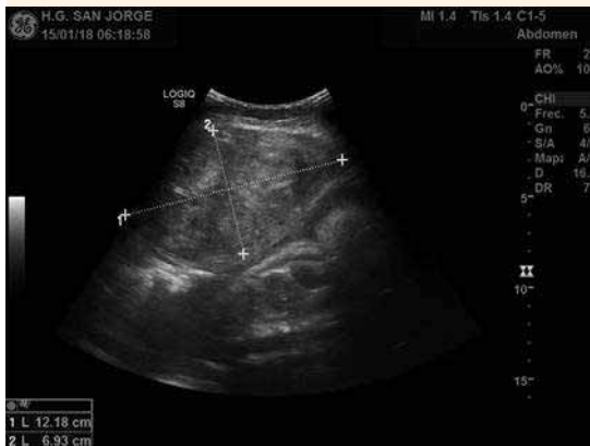
Figura 2. Ecografía abdominal al ingreso que muestra una masa ecogénica compatible con hematoma de pared abdominal.