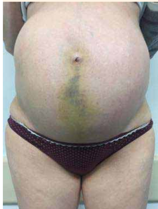
Figura 4. Signo de Cullen, equimosis periumbilical.