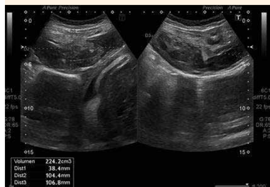
Figura 5. Ecografía de control evolutivo. Mayor componente líquido.