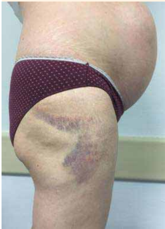
Figura 3. Signo de Gray-Turner. Equimosis en el flanco derecho.