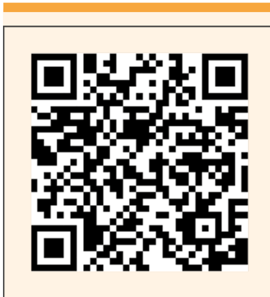
Figura 3. Para ver el vídeo de la técnica Posadas, apunte con su dispositivo al código QR o click en el enlace: https://www.youtube.com/watch?v=bbIVhy_Jtwc&t=9s

término de la ligadura de las arterias uterinas), hallazgos operatorios, estimación total del sangrado, complicaciones trans y posoperatorias, y evolución de las pacientes en las primeras 72 horas del procedimiento.