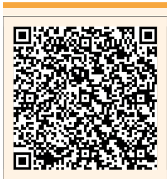
Figura 2. Para consultar el artículo con la descripción de la técnica Posadas,16 apunte con su dispositivo al código QR.

Se registró la información referente a variables obstétricas generales (edad de la madre, semanas de embarazo, antecedentes obstétricos, peso, talla y antecedentes perinatales), vía de finalización del embarazo, causa de la hemorragia obstétrica, tiempo de ejecución de la técnica (a partir de la exteriorización del útero y hasta el