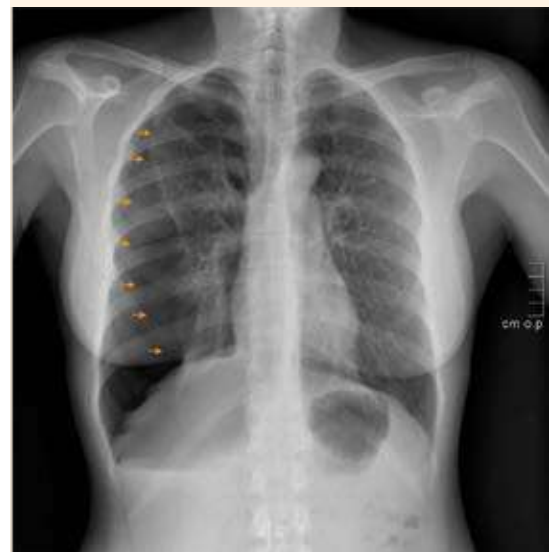
Figura 2. Neumotórax derecho, impresiona observar la adherencia de LSD a la pared.

de la segunda y tercera costillas (liberación de adherencias, bullectomía videotoracoscópica derecha con resección del vértice adherido y pleurodesis química con talco).