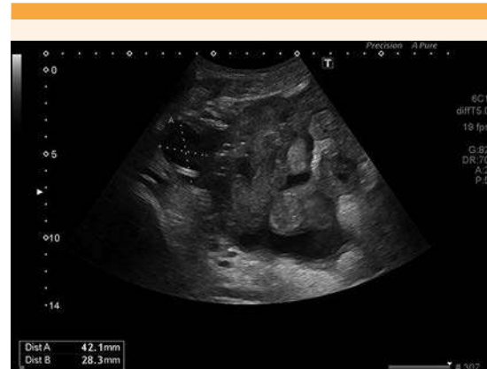
Figura 4. Ecografía de control el séptimo día después del drenaje percutáneo. Se observa un hematoma de menor tamaño que al ingreso hospitalario (42 x 28 mm). La imagen muestra las asas intestinales distendidas adyacentes.

día se efectuó el último control ecográfico de forma ambulatoria y después de comprobar la desaparición de la colección se retiró el drenaje.