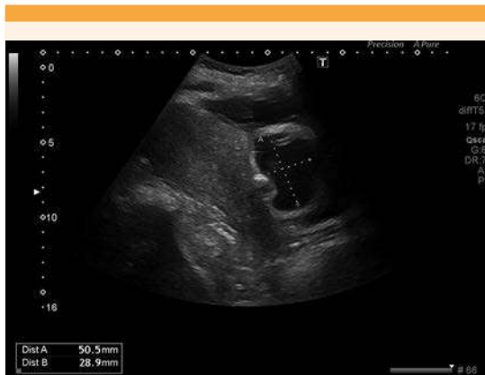
Figura 3. Corte sagital en el que se visualiza el cuerpo uterino y en la zona del segmento anterior una colección hipoeoica, de 50 x 29 mm, que corresponde a un hematoma vesicouterino.