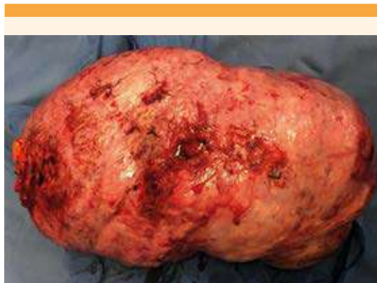
Figura 5. Pieza quirúrgica de leiomioma gigante degenerado, de 35 x 19 cm y 9150 g.