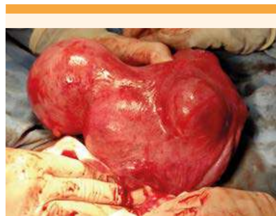
Figura 8. Útero exteriorizado transcesárea, posterior a la extracción del recién nacido, donde se aprecian los dos leiomiomas restantes.

evidente la estrecha relación con los factores hormonales de crecimiento tumoral. No obstante, son excepcionales los casos que ameriten una intervención quirúrgica y que, frecuentemente, se justifican por abdomen agudo relacionado con