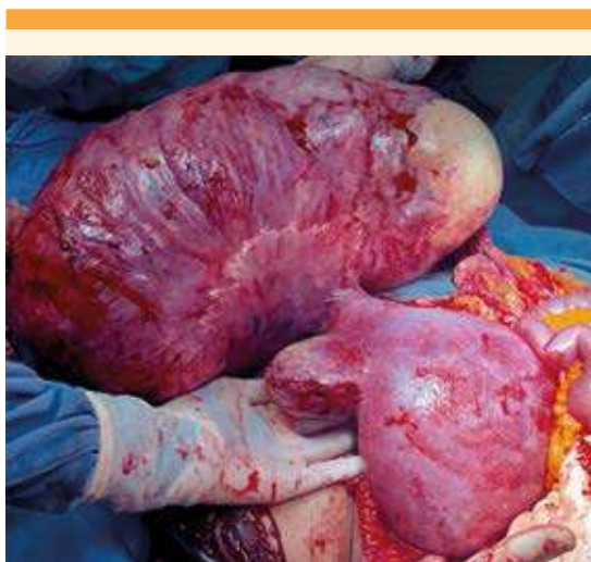
Figura 4. Los dos leiomiomas en los que se practicó la miomectomía y su relación respecto del útero gestante de 22 semanas.

La paciente permaneció durante 24 horas en observación, en la unidad de cuidados inten-