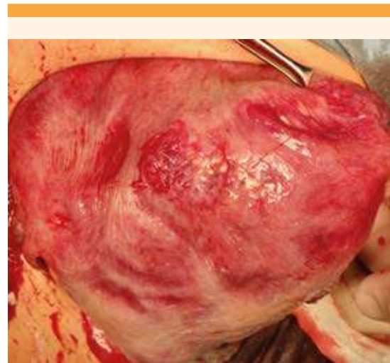
Figura 7. Útero exteriorizado transcesárea en el que se observan las dos zonas de cicatrización de la miomectomía previa.

La primera mitad del embarazo se asocia con mayor crecimiento del tumor, lo que hace