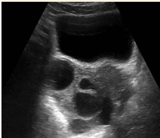
Figura 2. Ovarios de aspecto hiperestimulado. Ausencia de líquido libre en la pelvis.

La paciente ingresó a la unidad de Neumología y posteriormente quedó a cargo de Obstetricia, por sospecha de síndrome de hiperestimulación ovárica tardío severo, que requirió atención intrahospitalaria. Permaneció hospitalizada 10 días y se la trató con suero, albúmina intravenosa, furosemida por igual vía y heparina de bajo peso molecular a dosis profilácticas, con estricto control del equilibrio hídrico. Además, requirió dos toracocentesis evacuadoras más en las que se le extrajeron 1200 cc y 900 cc de trasudado. La mejoría clínica fue paulatina, sin evidencia de ascitis o edemas. En los controles ecográficos fue evidente la ausencia de líquido libre intraabdominal. La paciente fue dada de alta del hospital con síntomas leves, enseguida