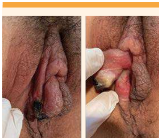
Figura 1. Úlcera vulvar de 48 a 72 horas de evolución.

La paciente fue nuevamente valorada en el plazo de una semana, advirtiéndose una importante mejoría clínica. El fragmento necrosado del labio menor derecho se había desprendido espontáneamente y la base de la úlcera se había