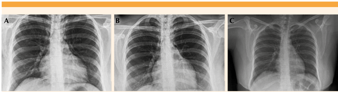
Figura 2. Evolución de la cardiomegalia en la radiografía de tórax. A) Radiografía de tórax al inicio. B) Radio-grafía de tórax a las 48 horas. C) Radiografía de tórax al mes.

desaparecieron y la paciente se dio de alta del hospital a los cuatro días posteriores a su ingreso. Continuó en vigilancia en la consulta externa de Neumología, sin evidencia de enfisema subcutáneo.