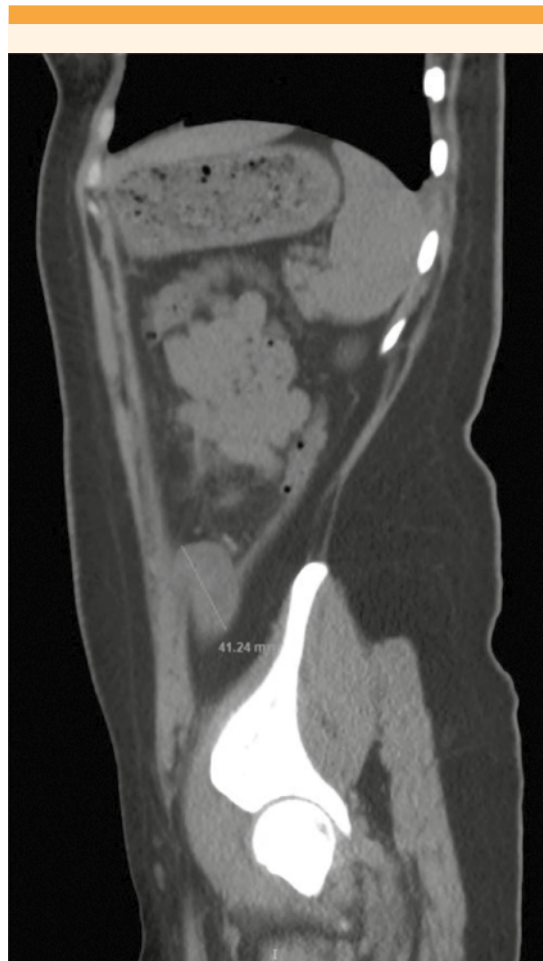
Figura 3. Tumor adherido al peritoneo parietal sugente de riñón ectópico.

hospital dos semanas después de su ingreso. El reporte de patología fue: útero didelfo, con lecho placentario de inserción alta en el fondo