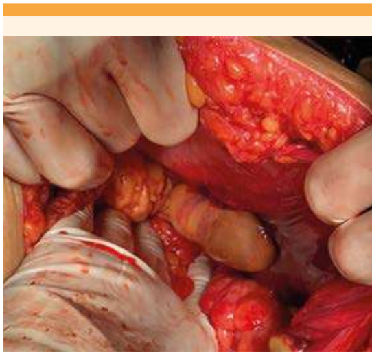
Figura 1. Tumor adherido al peritoneo parietal sugente de riñón ectópico.