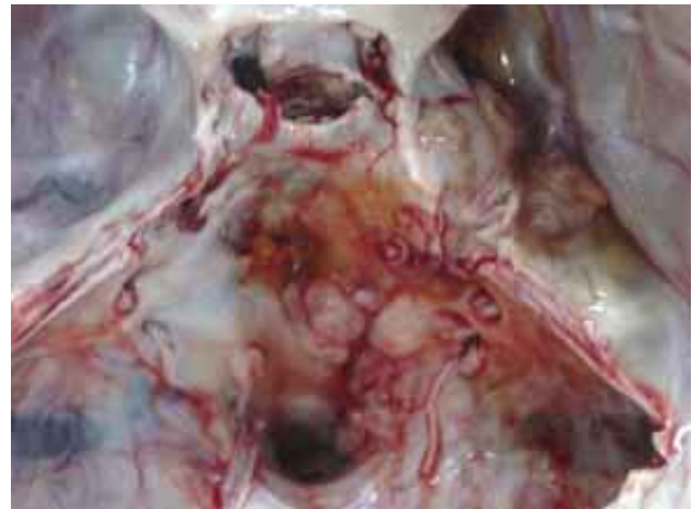
Figura 2. Nódulos metastásicos meníngeos en el lado derecho del piso de la fosa media, fosa posterior y canal medular.

Se efectuaron inmunorreacciones por la técnica de avidina-biotina, con anticuerpos para vimentina (Dako dilución 1/50), antígeno de membrana epitelial AME (Dako dilución 1/200) y citoqueratinas CKHg (Hg-1/50), actina músculo específica AME