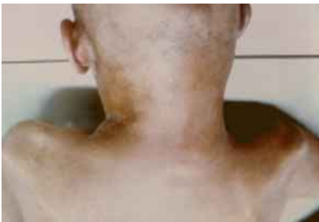
Figura 1. Tumor de los tejidos blandos del lado derecho de la nuca.

En la autopsia se encontró un gran tumor de 12 x 10 cm, blanco grisáceo, que alterna con zonas de necrosis, infiltraba los tejidos blandos de la nuca del lado derecho ( Figura 1 ), así como el lóbulo tiroideo derecho. En la cavidad craneana se hallaron varios nódulos meníngeos de aspecto metastásico localizados en el piso de la fosa media, fosa posterior y