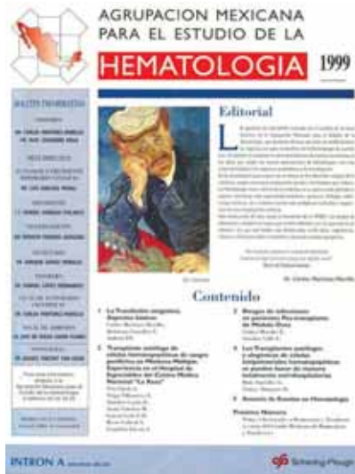
Figura 1. Portada del Boletín Informativo de la Agrupación Mexicana para el Estudio de la Hematología publicado en 1999.