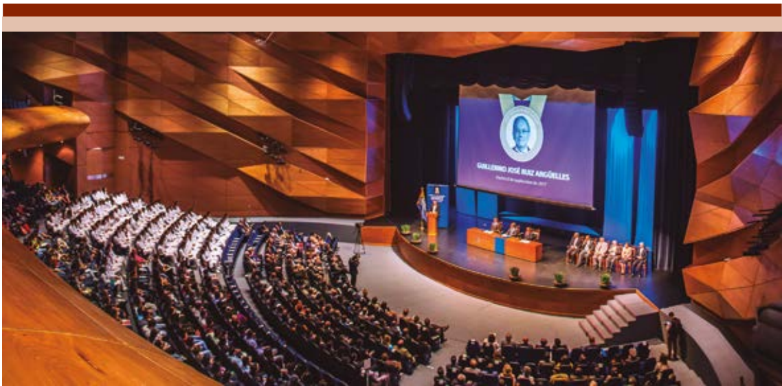
Figura 3. El acto se realizó el 8 de septiembre de 2017 en el auditorio del Centro Cultural Universitario Bicentenario en San Luis Potosí.