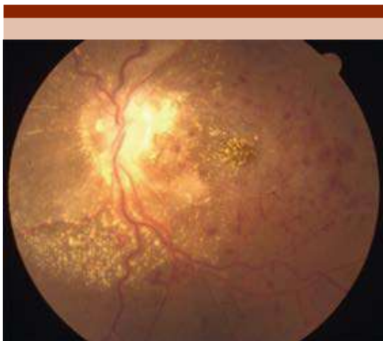
Figura 2. Fotografía clínica del ojo izquierdo postratamiento. Disminución del edema papilar, así como de las hemorragias en llama; exudados duros siguiendo la arcada inferior. Persistencia de la tortuosidad vascular.