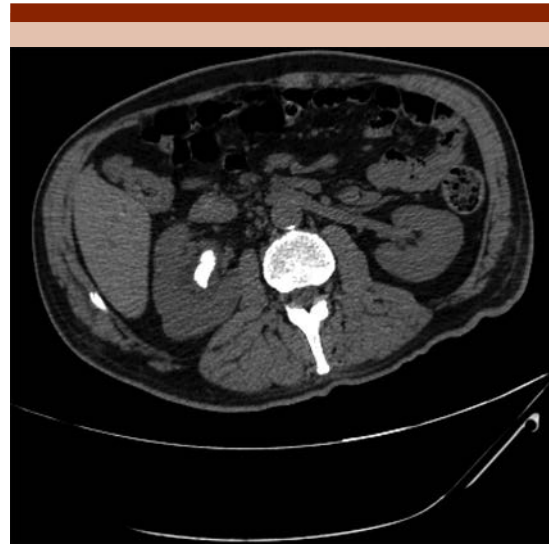
Figura 1. UroTAC simple de corte transversal, en la que se observa lito coraliforme derecho.

El paciente tuvo recuperación hematológica al día +50 de la quimioterapia, inició segunda posremisión con HiDAC (agosto de 2019) con persistencia de la hematuria y cuadros