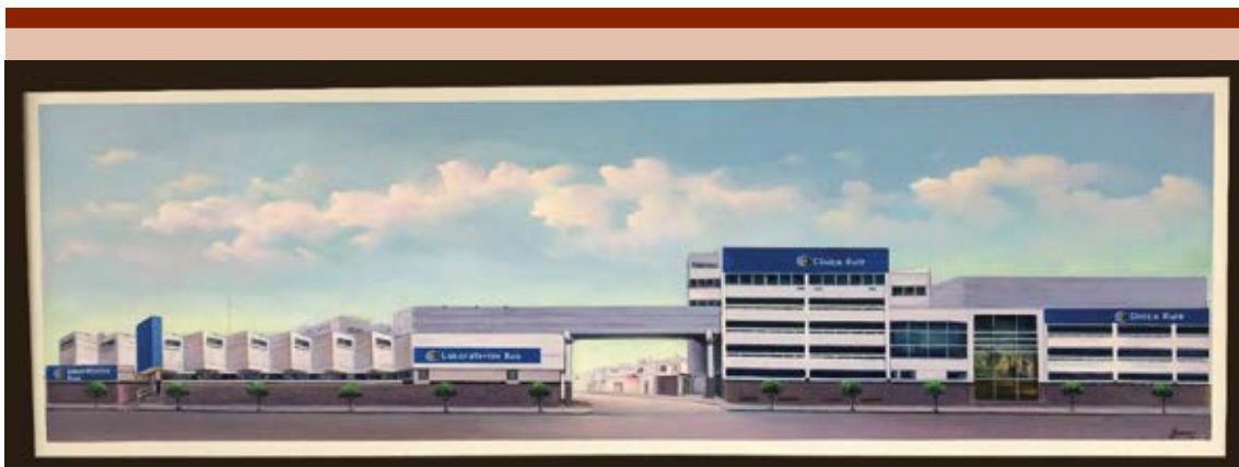
Figure 2. Current aspect of the Clínica Ruiz, including Laboratorios Ruiz, Centro de Hematología y Medicina Interna de Puebla and HSCT México.

la República Mexicana” . As of August 2022, more than 897 publications have been accumulated in scientific and medical journals. Tables 1 and