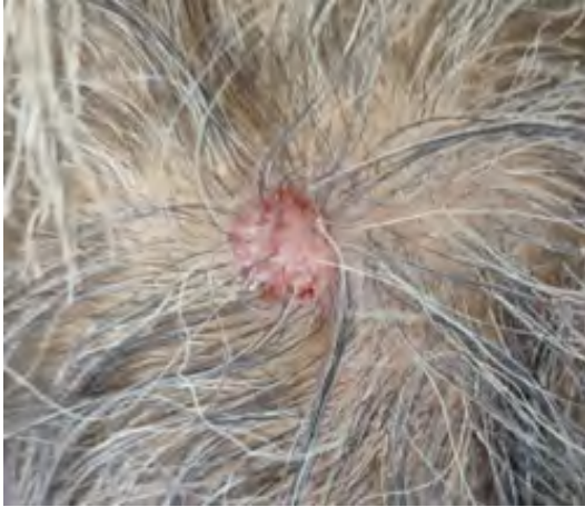
Figura 1. Impresión clínica de porocarcinoma en piel cabelluda, región de vértex: neoformación nodular sobreelevada, bien delimitada, eritematosa, de 25 × 24 mm.

La dermatoscopia mostró una lesión exofítica con patrón vascular polimorfo, compuesto por vasos irregulares, áreas rojo-lechosas irregulares, vasos en horquilla y lagunas rojo-hemorrágicas intercaladas con áreas hipopigmentadas (Figura 2).