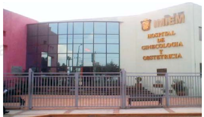
Figura 7. Hospital de Ginecología y Obstetricia.

Se cuenta con 3 Salas de Quirófano, 3 Salas de Expulsión, Central de Equipos y Esterilización, 1 Sala de Trabajo de Parto con 9 camas, Recuperación.