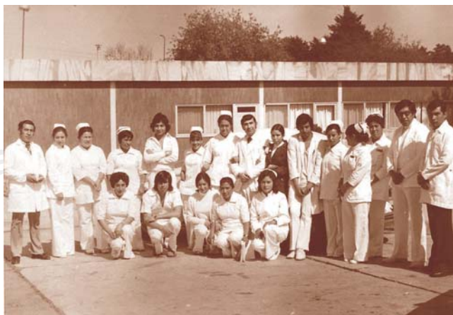
Figura 6. Personal médico y paramédico.