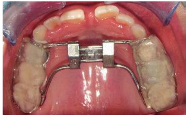
Figura 4: Hyrax MacNamara. Fotografía que obra en el Sistema Integral de Información Clínica y Administrativa (SIICA), Centro de Especialidades Odontológicas del Instituto Materno Infantil del Estado de México.

de Otorrinolaringología, orientan al diagnóstico de trastorno respiratorio del sueño (TRS). El doctor Gonzalo Nazar describe en su artículo que los TRS en pacientes pediátricos se asocian frecuentemente con respiración bucal, infecciones recurrentes de vías aéreas superiores y alteraciones en el desarrollo craneofacial, como el aumento del tercio inferior facial, maxilares estrechos o alteraciones en la oclusión. Asimismo, se ha reportado que la respiración bucal sostenida puede influir negativamente en el crecimiento transversal y sagital del maxilar, favoreciendo discrepancias esqueléticas y dentarias. 2,5,12