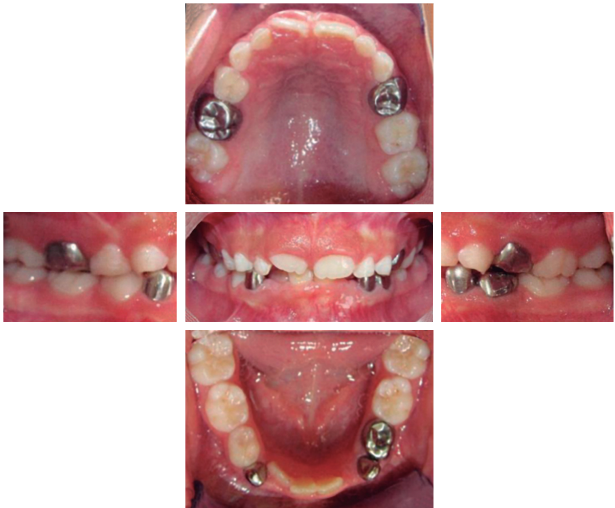
Figura 1: Serie fotográfica intraoral que evidencia las manifestaciones bucales de la paciente antes del tratamiento del trastorno respiratorio del sueño.