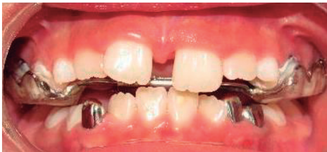
Figura 3: Disyunción media palatina.

La anamnesis y los resultados del cuestionario PSQ-19, así como la confirmación por el Servicio