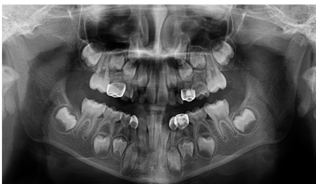
Figura 2: Ortopantomografía que obra en el Sistema Integral de Información Clínica y Administrativa (SIICA), Centro de Especialidades Odontológicas del Instituto Materno Infantil del Estado de México.