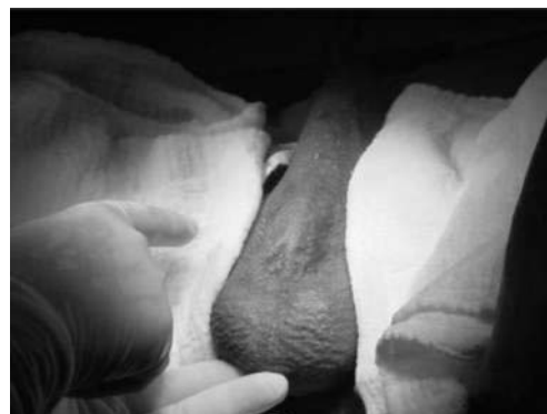
Figura 1. Tumor en región penescrotal

A la exploración física, cráneo normal, tórax sin alteraciones, abdomen y extremidades normales. Respecto a genitales, testículos normales y aumento de volumen en la región penescrotal. Mediante la palpación se detectó tumor duro y doloroso a la movilización (figura 1).