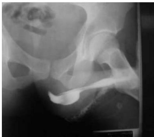
Figura 2. Uretrograma que muestra imagen de doble uretra e imagen sugestiva de cálculo en uretra accesoria a nivel de uretra bulbar

nescrotal a nivel de uretra bulbar por rafe medio, sobre la localización del tumor; se disecó hasta uretra accesoria abriendo la pared inferior, lo que permitió la visualización y extracción del cálculo. Las medidas aproximadas de éste fueron 3 cm de largo \times 2 cm de ancho (figuras 3 y 4).