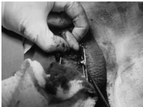
Figura 3. Extracción de cálculo de la uretra

Se revisó el tabique medio compartido por ambas uretras, verificando la distancia en sentido proximal hasta fondo de saco ciego, siendo de 5 cm desde la incisión y de 8 cm en sentido distal. Se suturó la pared inferior de la uretra accesoria y cerraron planos para concluir el procedimiento.