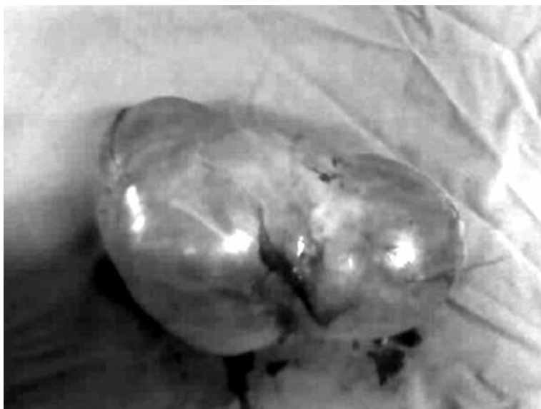
Figura 2. Tumor quístico de 16 × 12 × 10 cm, con superficie irregular