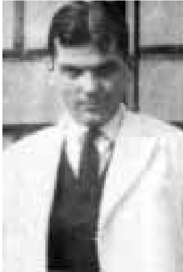
Figura 3. En 1995, la Universidad de Harvard concedió el grado de Doctor en Ciencias al profesor Albright por considerarlo “brillante investigador en el complejo campo de la nutrición y el metabolismo, por su mente profunda y enorme entusiasmo que honran y le dan prestigio tanto a la Universidad como a la medicina”. Albright dejó un legado de cerca de 200 publicaciones científicas, donde se describen nuevos síndromes. Entre otros descubrimientos notables se cuentan la acidosis tubular renal, la inhibición de la ovulación con

estrógenos como anticonceptivo, los prolactinomas hipofisarios, la fisiopatogenia del síndrome de Cushing, la asociación de hipogonadismo con osteoporosis, la azoospermia por disgenesia testicular, el hiperparatiroidismo como causa de litiasis renal, la producción ectópica de hormonas, y los síndromes de resistencia hormonal. Para fundamentar sus teorías, Albright desarrolló técnicas de laboratorio que fueron utilizadas por varios años. Albright se graduó cum laude en Harvard Collage y posteriormente ingresó a la Escuela de Medicina de Harvard, donde mostró un gran interés por la obstetricia y la ortopedia pero reconociendo su limitada destreza manual siguió la medicina interna. Realizó su internado médico en Massachusetts General Hospital , incluyendo investigación bajo la tutela de J. C. Aub, experto en el metabolismo del calcio. La residencia médica la hizo en Johns Hopkins Hospital , en Baltimore, y después estuvo como research fellow en Viena, con Jacob Erdheim. En 1930, Albright regresó a Boston para dedicarse por el resto de su vida a la enseñanza, investigación y práctica clínica. En 1937, cuando se encontraba en la cúspide profesional, aparecieron los primeros síntomas de la enfermedad de Parkinson. La progresiva incapacidad física lo llevó a decidir someterse en 1958 a una cirugía cerebral experimental, la cual se complicó con una hemorragia masiva que lo llevó a un estado comatoso irreversible e invalidez total hasta su muerte en 1969. 14