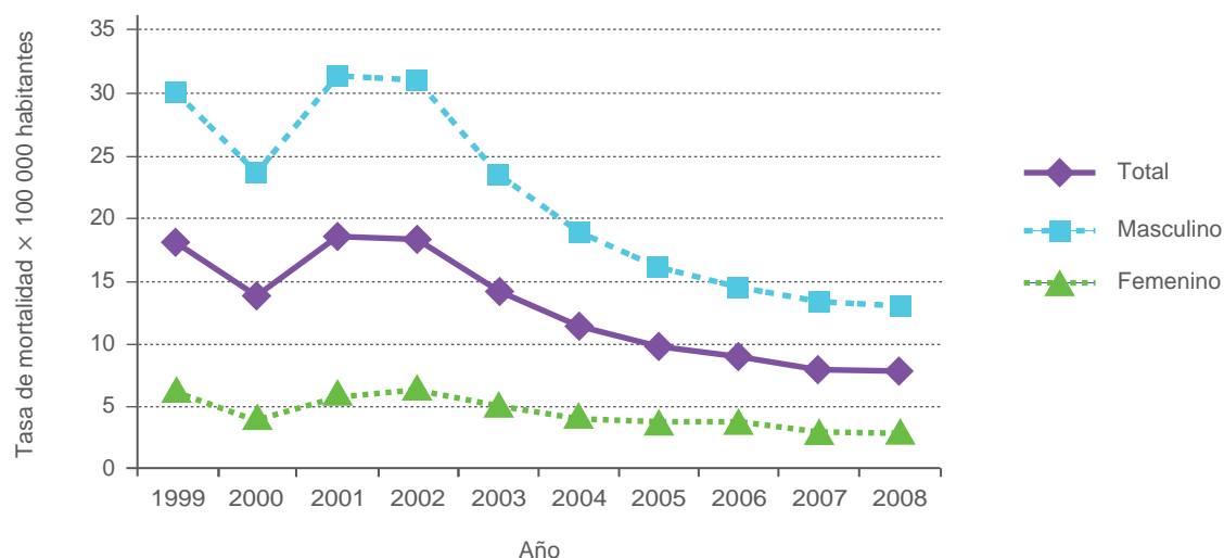
Figura 1 Tendencia de la mortalidad por trauma craneoencefálico en niños y adolescentes en Colombia

Los datos de las víctimas fatales de las acciones bélicas relacionadas con el conflicto armado colombiano