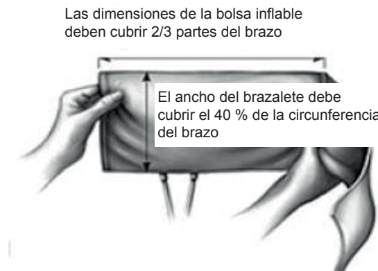
Figura 2 Estimación del tamaño del brazalete en relación con la circunferencia del brazo. Las dimensiones de la bolsa inflable del brazalete deben cubrir del 80 al 100 % de la circunferencia del brazo