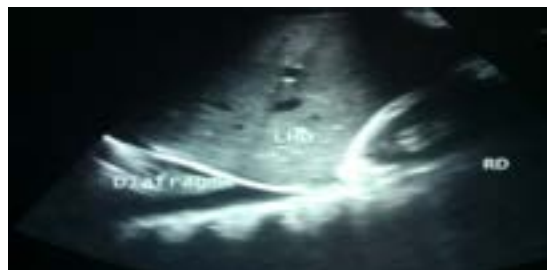
Figura 1 Ultrasonografía de abdomen superior

Hombre de 42 años, de complexión delgada y sin antecedentes médicos de importancia. Presentó cuadro de dolor abdominal, de aparición súbita y de moderada intensidad en epigastrio con dos semanas de evolución. El dolor era opresivo con irradiación a hipocondrio derecho, además de náuseas y malestar general; acudió al servicio de Urgencias ante la sospecha de colecistitis crónica litiásica agudizada. Se le hizo ultrasonografía (USG) abdominal (figura 1), la cual reportó hepatomegalia con lodo biliar vesicular y derrame pleural derecho.