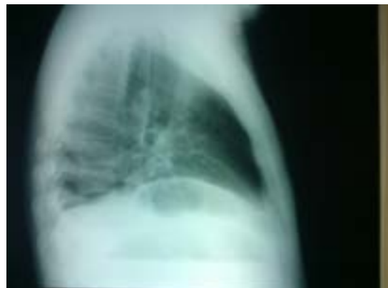
Figuras 3 y 4 Radiografía anteroposterior y lateral de tórax