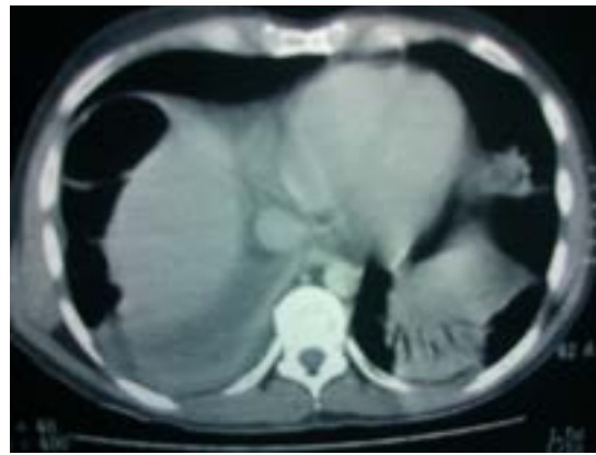
Figura 2 Tomografía axial computarizada de abdomen

Se administró un doble esquema antibiótico con carbapenémico y fluoroquinolona. Los exámenes de laboratorio de ingreso al servicio de Urgencias reportaron los siguientes valores: glucosa 117, BUN 20, urea 43, creatinina 1.2, ácido úrico 3, colesterol 149, triglicéridos 87, bilirrubina total 1.1, bilirrubina directa 0.3, bilirrubina indirecta 0.8, AST 25, ALT 40, amilasa 211, lipasa 1820. Leucocitos 10 500, Hb 12.4, Hto 36, plaquetas 261 00. El examen general de orina (EGO) presentó proteinuria de 100 mg/dL. El paciente ingresó a Medicina Interna, se mantuvo estable sin vómica, sin fiebre ni manifestaciones de respuesta inflamatoria sistémica, sin datos de sepsis, no se integró síndrome pleuropulmonar. Después de 10 días de