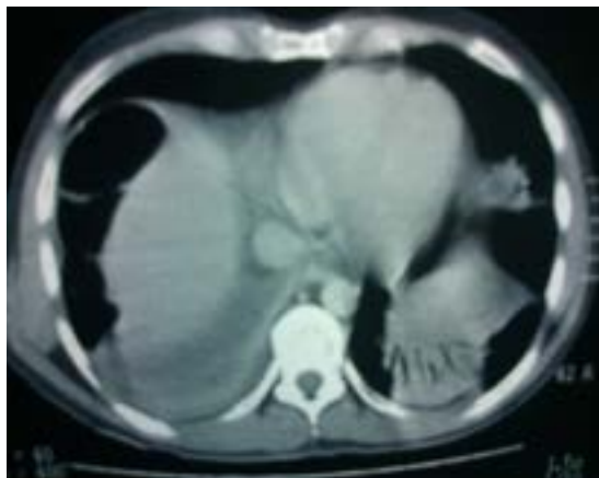
Figura 7 Tomografía de tórax de control se visualizan haustros de colon derecho

Se han descrito tres formas de interposición hepatodiafrágicas posibles: