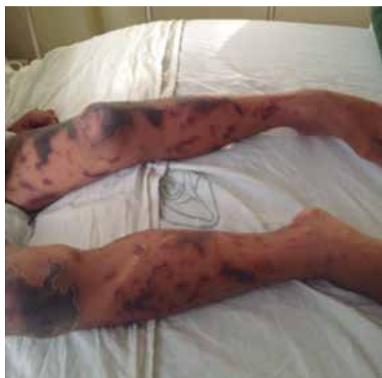
Figuras 3 y 4 Lesiones en su quinto día de evolución