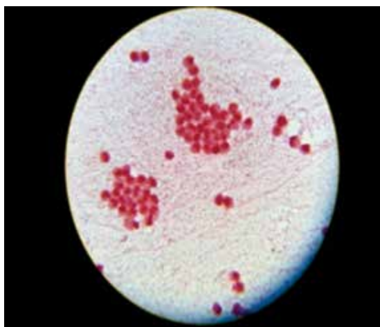
Figura 5 Cultivo de Neisseria meningitidis en líquido cefalorraquídeo