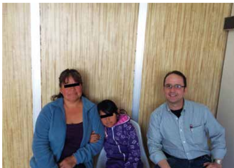
Figura 7 La paciente (al centro) un año después

Los seres humanos son portadores asintomáticos de este germen, 3,7,12 mismo que espera hasta que se rompa la triada ecológica para así activarse como enfermedad. Sería conveniente que en el país se incluyera la vacuna