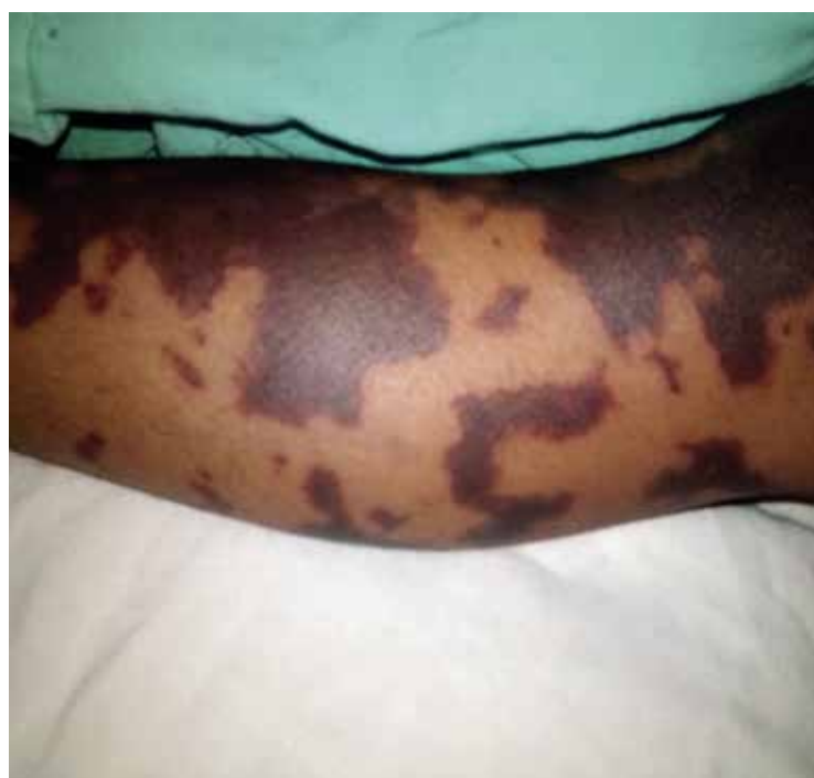
Figuras 1 y 2 Lesiones en piel a 6-8 horas de inicio: hombro y brazo izquierdo (figura 1) y pierna izquierda (figura 2)