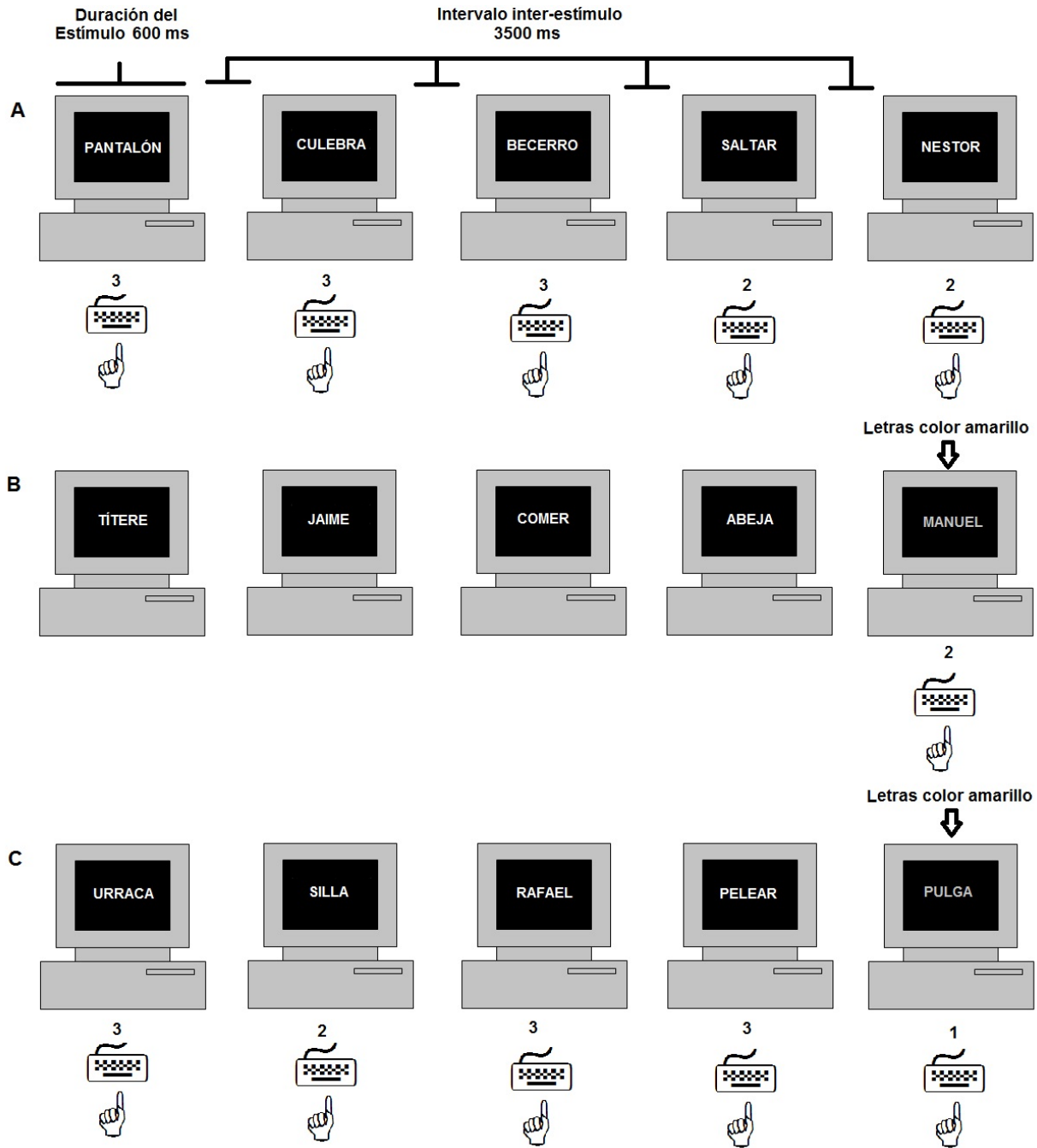
Figura 1. Forma en que se presentan los estímulos en las tres fases que conforman la prueba PAVOX. A) En la fase de conteo de vocales, se debe contar el número de vocales en cada palabra. B) En la fase de categorización se debe recordar las categorías semánticas de las primeras cuatro palabras (escritas de color blanco) y posteriormente, en la quinta palabra (escrita en color amarillo) se debe indicar cuál es la posición en la que apareció un estímulo con la misma categoría; en este ejemplo, MANUEL coincidió con JAIME en que ambos son nombres; como JAIME apareció en la segunda posición, se debe oprimir la tecla 2. C) En la fase dual se deben contar vocales en las primeras cuatro palabras (en el ejemplo, 3, 2, 3, y 3), y en la quinta se debe categorizar la palabra que aparece en amarillo; en el ejemplo, ante la quinta palabra se debe responder 1, pues PULGA es un animal como URRACA que apareció en la primera posición.