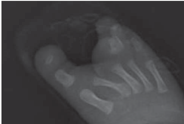
Figura 6. Pie derecho con defecto Tipo II de Blauth and Borisch.

Los casos de ectrodactilia pueden estar asociados a otras malformaciones y formar parte de síndromes bien descritos, que cursan con alteraciones del