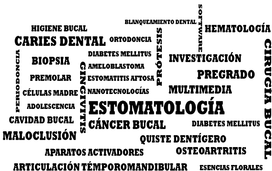
Figura 2 Nube de palabras clave utilizadas en las investigaciones.

Es válido señalar que la participación está centrada fundamentalmente en los estudiantes de cuarto año de la carrera (32.35%). Ello pudiera estar relacionado con un acceso tardío al mundo de la investigación dentro de las