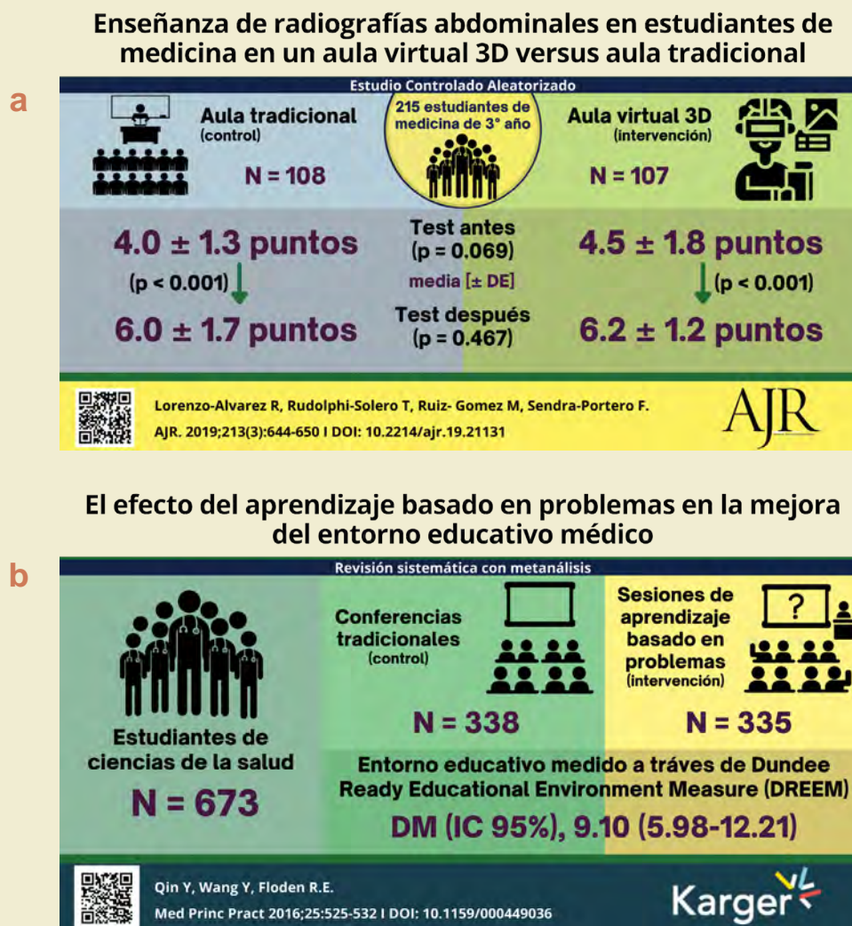
Figura 2. Ejemplos de estructuras de resúmenes visuales para estudios controlados aleatorizados (a) y revisiones sistemáticas (b)

En seguida se detallan los pasos a seguir para la creación de un resumen visual, lo que es resumido en