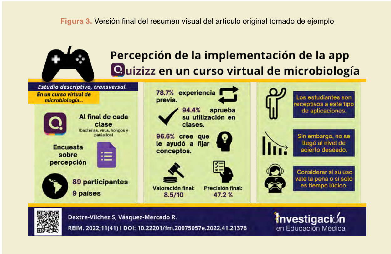
Figura 3. Versión final del resumen visual del artículo original tomado de ejemplo

registra con un correo institucional educativo. Esto último denominado Canva para Educación.