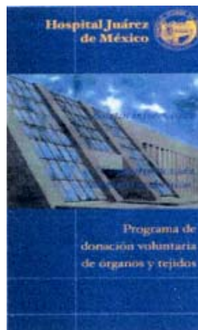
Figura 3. Folleto elaborado para promover la cultura de la donación voluntaria de órganos y tejidos en el Hospital Juárez de México.

En lo académico es importante señalar que el curso del Posgrado de Trasplante Renal inició en 1994 con reconocimiento de la Secretaría de Salud y a partir de 1999 con el reconocimiento de la Universidad Nacional Autónoma de México, siendo en ese año el primer hospital en el