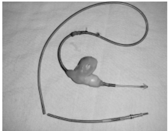
Figura 3. Cable de marcapasos donde se muestra vegetación de 3 x 3 x 1 cm.

de la piel como son pacientes con accesos venosos con fines médicos, como la instalación de catéteres de hemodiálisis o pacientes adictos a drogas intravenosas. Por ejemplo, en pacientes con catéter intravenoso para hemodiálisis durante un seguimiento de más de 15 años se demostró una incidencia de 15% de endocarditis, sobre todo en aquellos pacientes que tenían además un marcapasos. 5 Otros grupo vulnerable son los pacientes con cortocircuito intracardiaco, lesión estructural valvular y todos aquellos que requieren la colocación de dis-