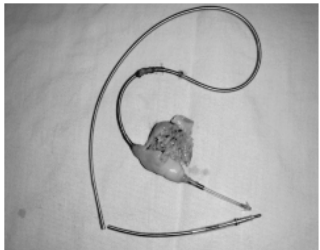
Figura 4. Muestra vegetación de cable de marcapasos posterior a incisión quirúrgica.