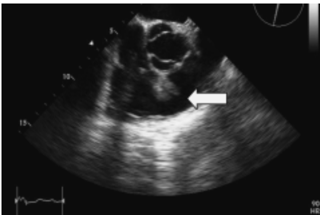
Figura 2. Ecocardiograma transesofágico donde se observa vegetación en cable de marcapasos (flecha).