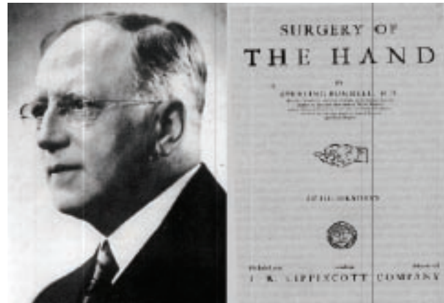
Figura 3. Padre de la Cirugía de Mano en Estados Unidos y su libro "Cirugía de la mano".

Sterling Bunnell, considerado por todos como el padre de la cirugía de mano en Estados Unidos, fue un cirujano general de la ciudad de San Francisco. Su primer trabajo sobre esta especialidad lo publicó en 1918 y culminó con su 1a. edición de su libro "Surgery of the hand" , en 1944,