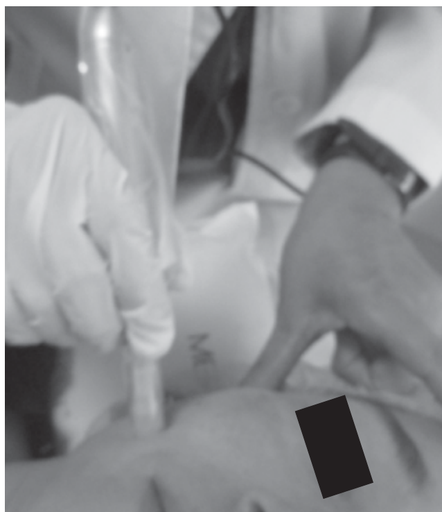
Figura 3. Utilización de dermoabrasión con microagujas en paciente con rosácea facial.

En un estudio piloto realizado por Dhurat y cols. 19 se incluyeron dos grupos de pacientes con alopecia moderada a severa de origen androgénico, cada grupo constó de 50 pacientes, a un grupo se le aplicó dermoabrasión con microagujas más aplicación tópica de loción minoxidil al 5%, en tanto que al otro grupo únicamente se le trató con la aplicación tópica de minoxidil al 5%. De los pacientes tratados con dermoabrasión con microagujas más minoxidil 41 (82%) reportaron más de 50% de mejoría, en tanto que únicamente dos (4.5%) de los pacientes del grupo tratado únicamente con minoxidil; asimismo, el recuento de pelo en la semana 12 fue significativamente mayor para el grupo de dermoabrasión con microagujas más minoxidil en comparación con el grupo minoxidil solo (91.4 vs. 22.2,