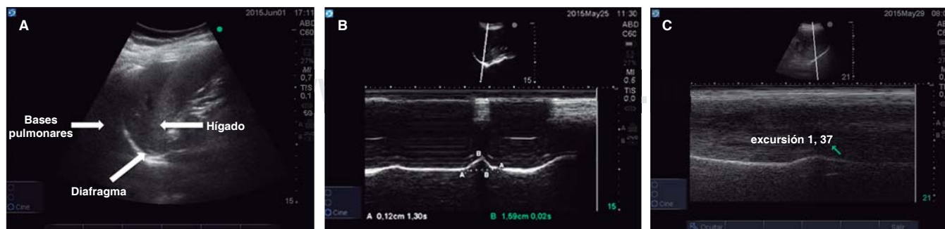
Figura 2. A. Anatomía ultrasonográfica en modo bidimensional para la localización del diafragma durante la evaluación de la excursión del mismo. B. El ultrasonido diafragmático en modo M permite visualizar la excursión diafragmática en el paciente con VM en modo espontáneo con presión soporte, la cual se encuentra por encima del mínimo necesario para el retiro de la VM. C. Ultrasonido diafragmático en modo M en un individuo con VM y presencia de disfunción diafragmática asociada con la misma.