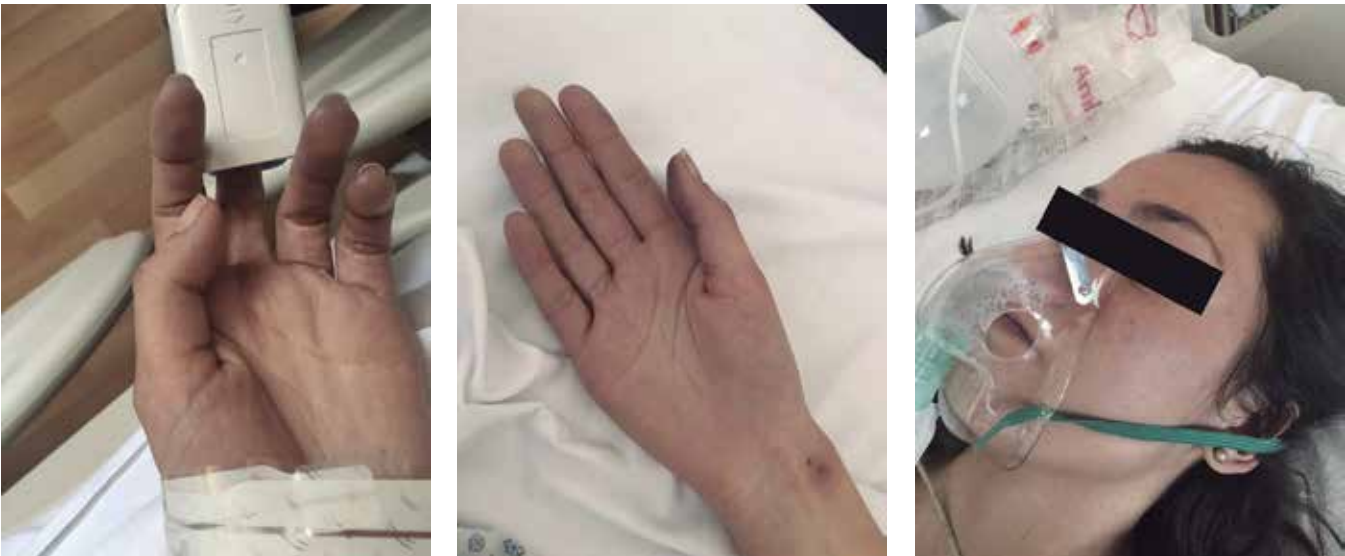
Figura 1. Fotografía al momento de la valoración inicial por medicina crítica en la que se observa paciente con cianosis de predominio periférico.