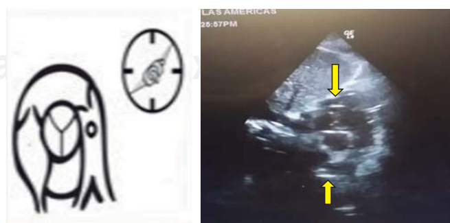
Figura 2. Eje corto, a nivel de grandes vasos, ventana subcostal. Se observa el CAP pasar por infundíbulo pulmonar y localizarse en la arteria pulmonar (flechas).