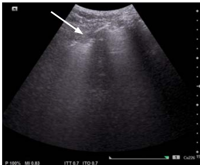
Figura 2: Consolidación subpleural (punta de la flecha) en modo bidimensional con transductor convexo.

atención en la zona axilar y finalizando en el seno costo diafragmático (lugar más frecuente de consolidaciones iniciales). El foco se situará a nivel de la línea pleural, se podrán realizar cortes longitudinales y transversales.