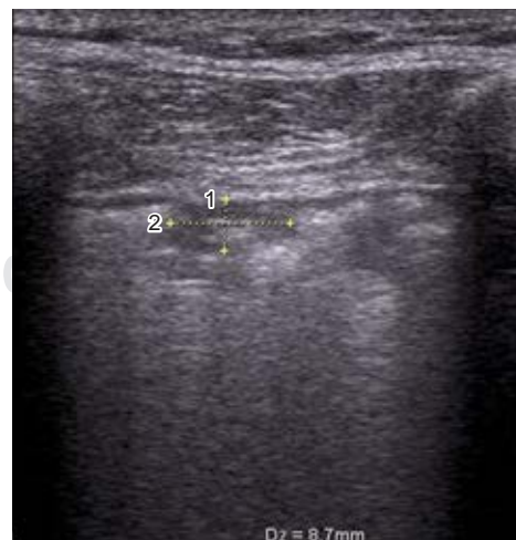
Figura 1: Consolidación subpleural en modo bidimensional con transductor lineal.

Previo preparación del equipo, elección de los transductores y adecuada colocación del equipo de protección (colocación de traje Tyvek, botas, guantes, gafas protectoras, N95 y careta) se procedió a insonar al paciente en posición decúbito supino tanto en ventilación espontánea como en aquellos con ventilación mecánica asistida. Se dividió cada hemitórax en cuatro cuadrantes delimitados por la línea paraesternal media, axilar anterior y axilar posterior, interceptados por una línea horizontal que pase a nivel de la línea mamaria; se comienza explorando el hemitórax anterior derecho y luego el izquierdo, en sentido cráneo caudal (comenzar la exploración a nivel de la clavícula y finalizar cuando se vea la viscera abdominal), recorriendo longitudinalmente todo el espacio intercostal entre la línea paraesternal y axilar anterior, explorar la zona lateral de la misma manera en sentido cráneo caudal poniendo especial