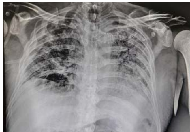
Figura 4: Radiografía de tórax de control posterior a retiro de la sonda endopleural.

mantener una vigilancia estrecha ante la posibilidad de complicaciones hemodinámicas y respiratorias, las cuales podrían representar un marcador de la progresión de la enfermedad. El neumotórax, el neumomediastino y las lesiones pulmonares como las bullas en pacientes con COVID-19 probablemente se deben a un daño inflamatorio prolongado del parénquima pulmonar con el desarrollo de cambios degenerativos (fibrosis), ruptura y posteriores fugas de aire.