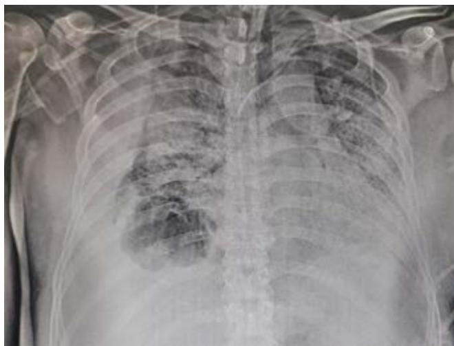
Figura 1: Radiografía anteroposterior de tórax que muestra opacidades alveolares e imagen radiolúcida en el tercio inferior derecho.

Se decide colocar sonda endopleural en quinto espacio intercostal en su intersección con la línea axilar media derecha obteniendo 200 mL de material serohemático, se conecta a succión continua, se verifica colocación de sonda endopleural con control radiográfico posterior (Figura 3). Se solicita valoración por el servicio cirugía de tórax, quien indica manejo conservador con seguimiento a través de estudios de imagen. Se retira la sonda endopleural a los 10 días de colocada, corroborando expansión pulmonar (Figura 4). Se logra el retiro de la ventilación a los 68 días de iniciado el cuadro y 58 días de ventilación mecánica tolerando de manera adecuada, siendo egresado a sala general para continuar con su manejo.