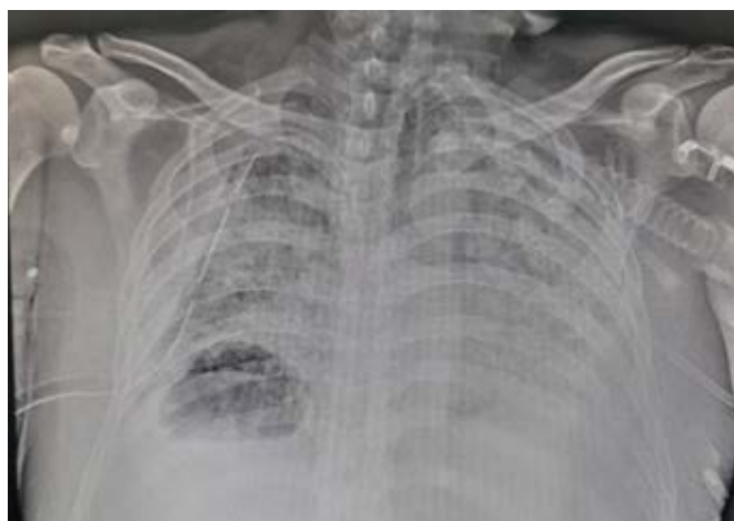
Figura 3: Radiografía de tórax de control postcolocación de sonda endopleural.

Se desconoce el mecanismo exacto por el que se produce neumotórax y bullas en los pacientes con neumonía por SARS-CoV-2, pero se considera que tienen una respuesta favorable a medidas conservadoras. Sin embargo, es importante realizar un diagnóstico temprano y